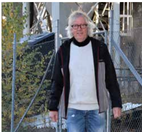
↑ PÅ GAMLE TOMTER: «Mulen» var i mange år fabrikkarbeider på Norcem.