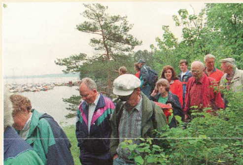
Vandring på Blakstad, åpningsdagen 11. juni 1995.

Kyststien som ble åpnet i 1994 og 1995, er en ca. 15 km lang, merket sti. Langs stien er det satt opp små informasjonsskilt som gjør din vandring til en historisk opplevelse.