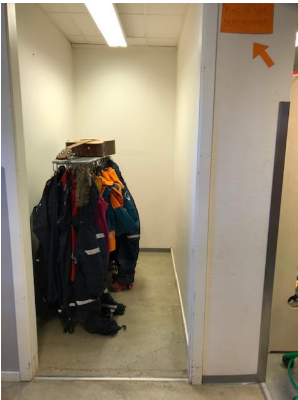
Alternativ garderobeplass for barna på den største avdelingen.