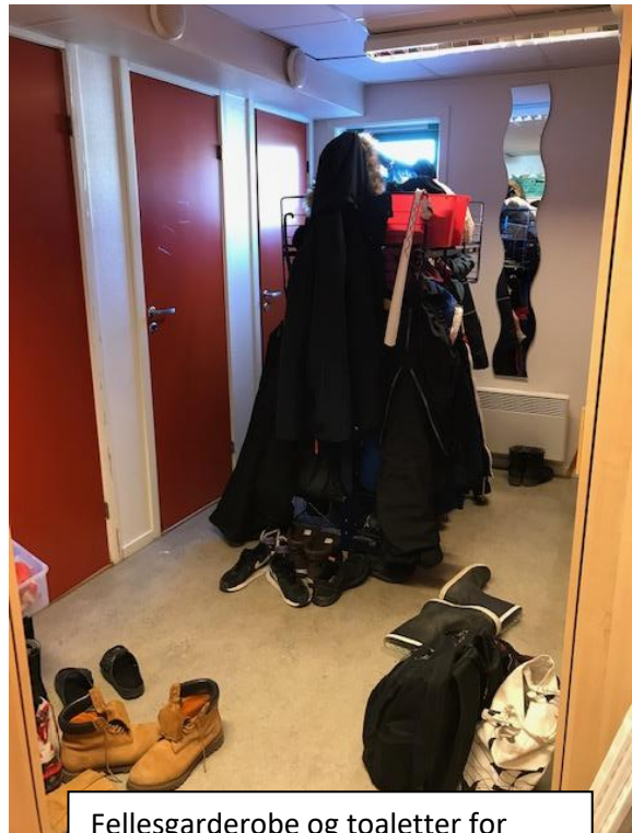
Fellesgarderobe og toaletter for personalet.