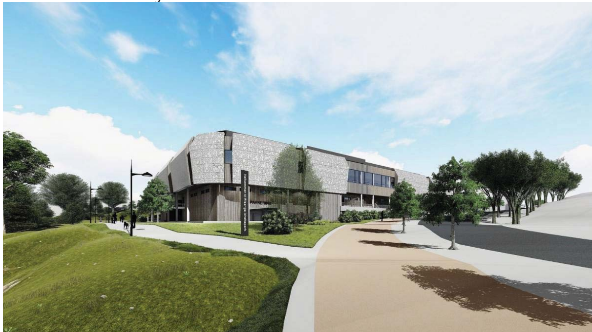
Ny ishall, sett fra Bleikerveien, Asker sentrum mot nord-

billettsalg, skilting, plakater og i pressesammenheng, mens kommunens navn skal bestå, og noteres på kartene. Nye sponsor partnere vil kunne endre navnet, selv om dette er lite trolig. Telenor arena er for eksempel et sponsor navn. Alle vet hvor den ligger, men navnet er ikke å finne på Bærum kommunes egne kart. Google kart derimot -inneholder mange kommersielle navn, slik sett er de søkbare i GPS verktøy.