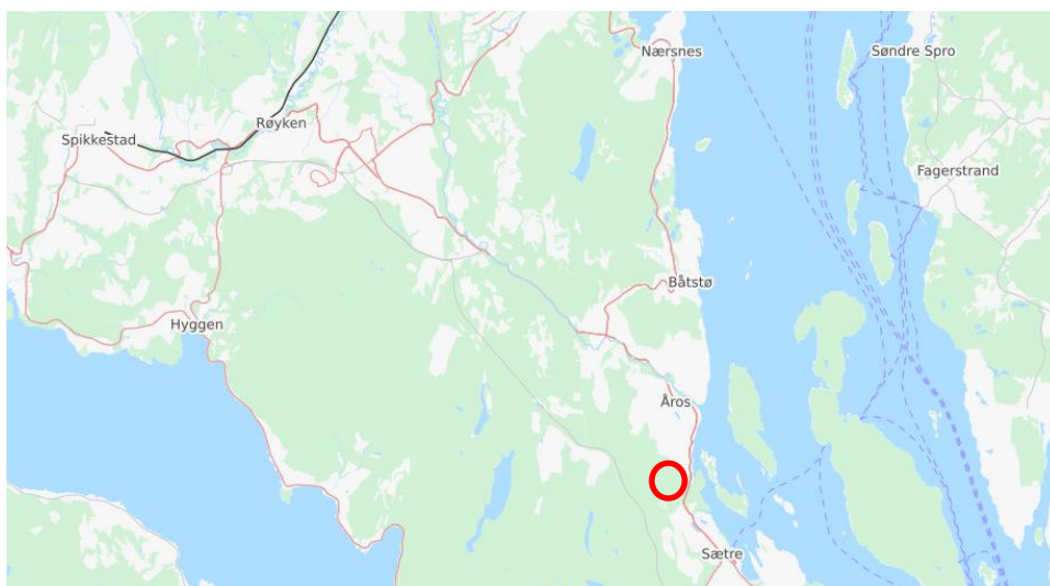
Figur 1 Planområdets beliggenhet

T +47 22 51 80 00 F +47 22 51 80 01 https://no.ramboll.com